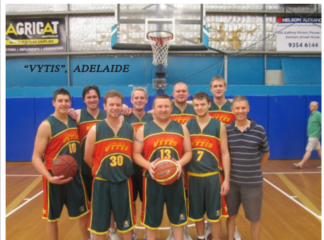
Women's Basketball, Mixed Basketball, Exhibition Basketball game – Lithuanian TONYBET Team and Men Rinktinė Exhibition Basketball game scores published in next edition.

Melbourne Lithuanian Sports Club "Varpas"