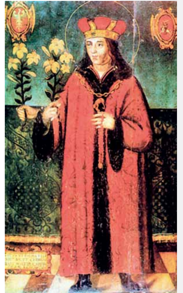
Šv. Kazimieras.