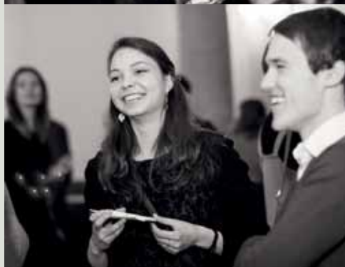
Po koncerto laukė gimtadieninis tortas ir bendravimas