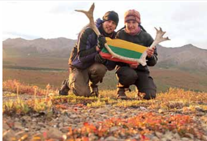
Besimėtantys elnių ragai. Iter Vitae komanda. Aliaska. JAV