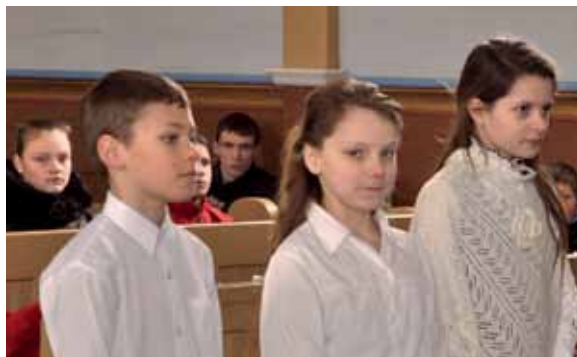
Kandidatai jaunųjų ateitininkų įžodžiui pasiruošę.