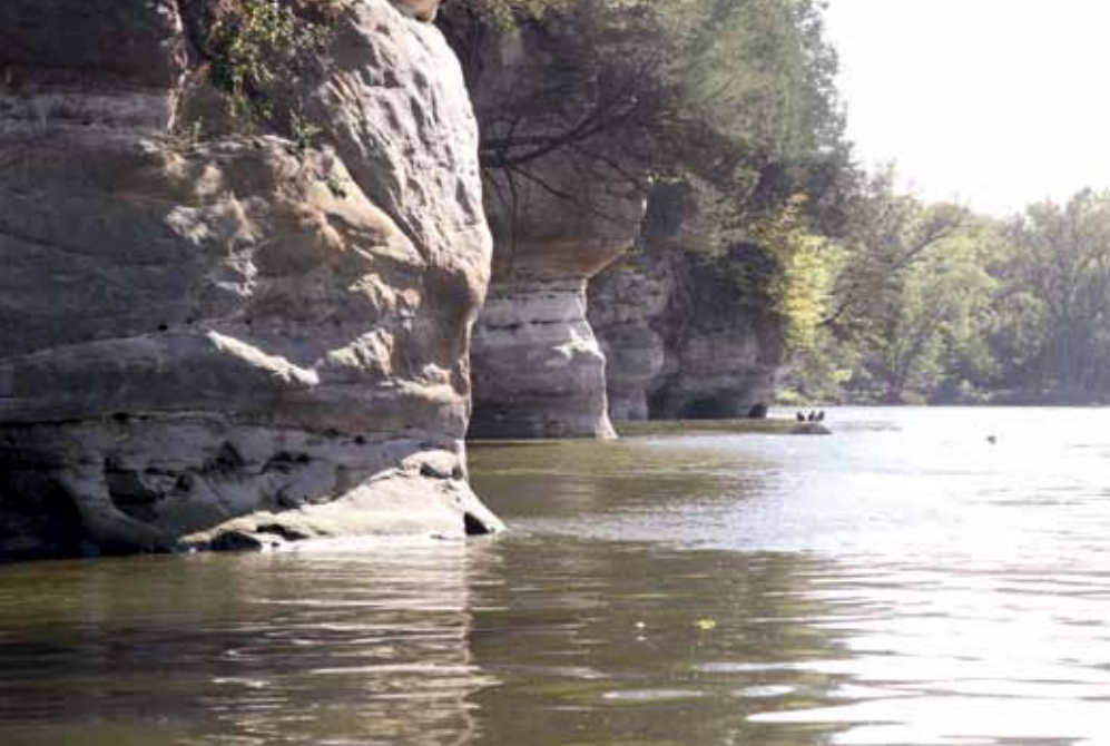
Mūsų pradžia – Fokso upėje, kuria keliausime iki Ilinojaus upės. JAV